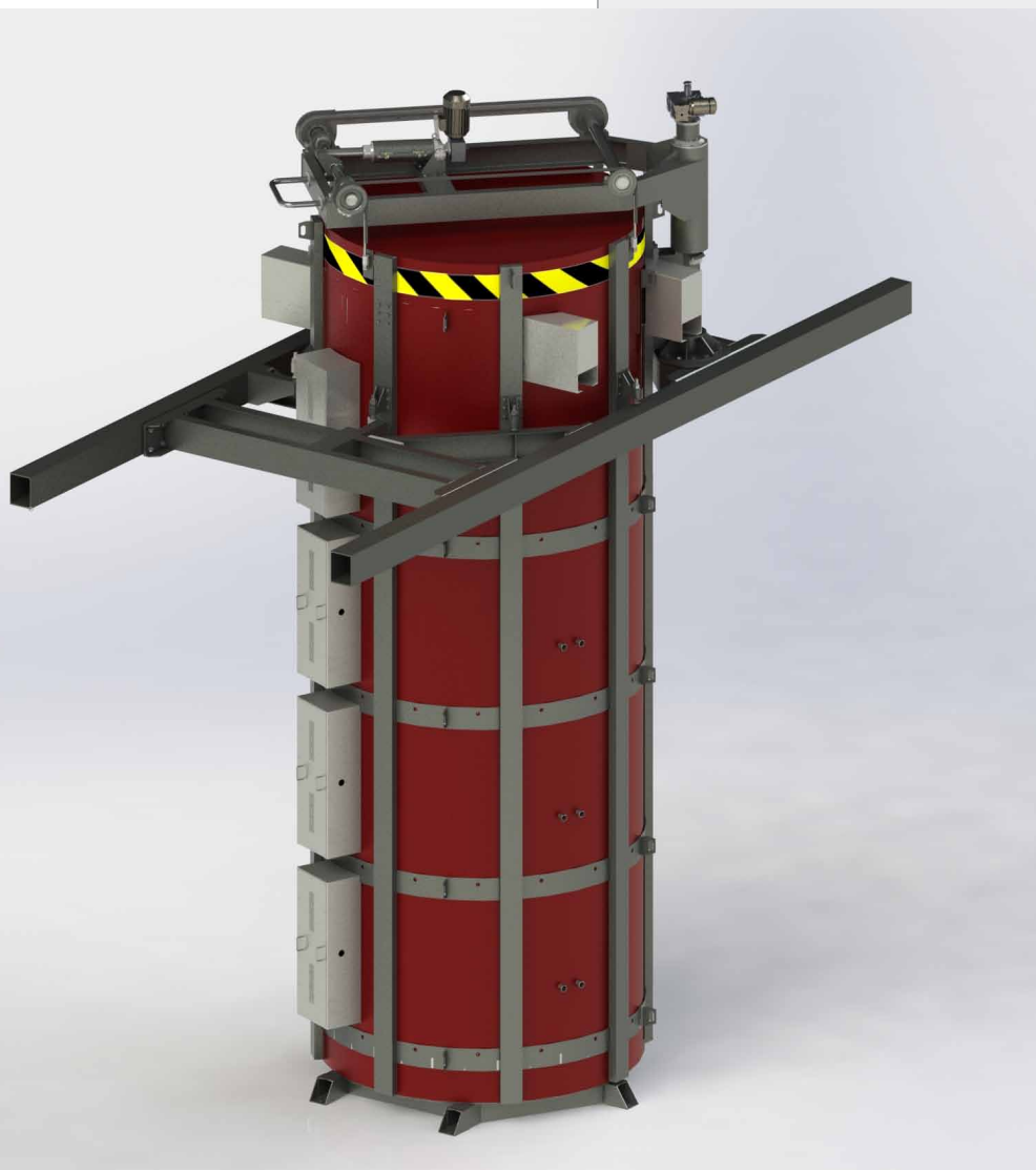
Рис. 1. Общий вид модульной шахтной безмуфельной электропечи модели СШО-16.50/12,5-ИО-НИТТИН.